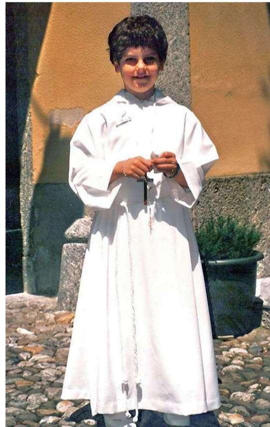
Hl. Carlo Acutis bei seiner Erstkommunion mit 7 Jahren.

Öffnungszeiten: Sonn- und Feiertage im Mai (außer Pfingsten), nach den Gottesdiensten (10:30 und 18:30 Uhr).