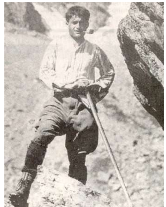
Pier Giorgio Frassati (1901-1925) Altarbild im Dom in Turin und beim Bergsteigen, aus Heiligenlexikon * 06. April 1901 in Turin in Italien, † 04. Juli 1925 in Turin in Italien